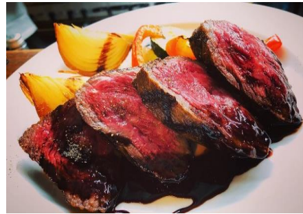
当店人気No1 鴨胸肉のロースト