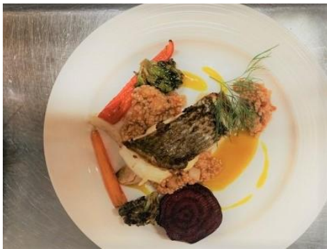
産地厳選 鮮魚のロースト ~クスクス添え~